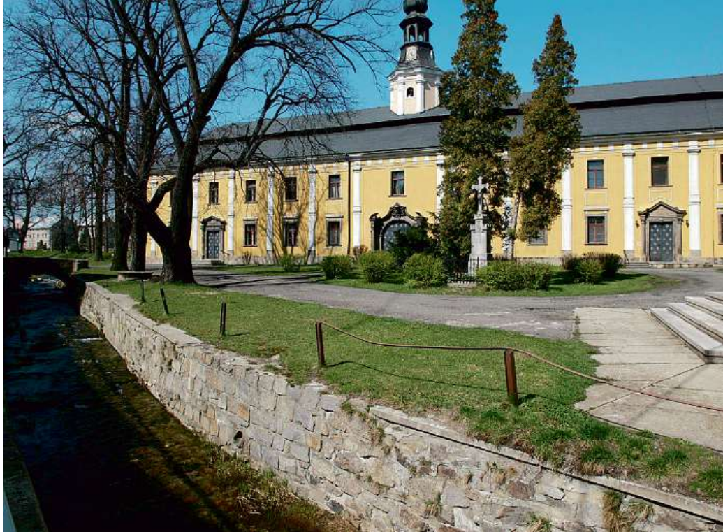
▲ Obec Bílá Voda v okrese Jeseník dala název poslednímu románu Kateřiny Tučkové. Nachází se tam piaristický klášter, kde se děj příběhu odehrává.

Přítomnost zla, o němž jste mluvil, je odvrácená strana mince dobra. Bohyně byly často popisovány jako pomocnice v nesnázích, ale byly mezi nimi i ty, co se specializovaly na černou magii. K těm přicházeli klienti, kteří někomu chtěli způsobit bolest nebo přivodit smrt, na jejich přání proto takové bosorky konaly černé mše. V soudních spisech ze 30. let minulého století jsem našla i zdokumentované, jak takové obřady probíhaly. A ačkoliv se tenkrát u soudu nepodařilo prokázat, že černá mše byla příčinou smrti nějakého nebožáka, stejně věřím, že věci mezi nebem a zemí existují... Třeba psychosomatické problémy bohyně dokázaly ošetřit tak,