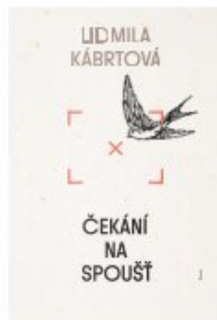
Host, 299 Kč, vychází 14. října

Vaše novinka se na pultech knihkupectví objeví za pár dní. Schválně, co se vám honí hlavou?