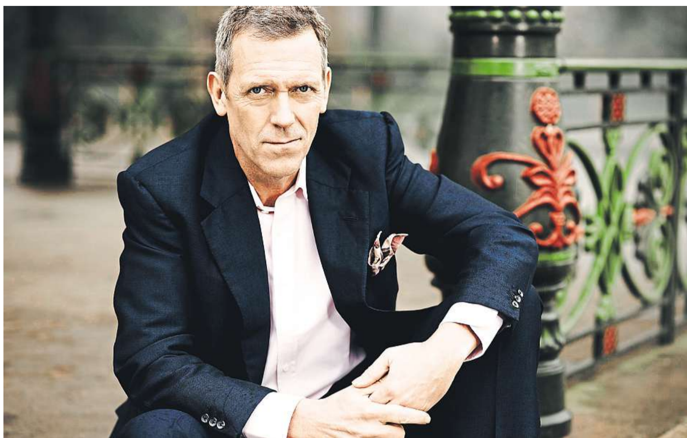
Našel dobrý recept. Ačkoliv má za sebou teprve dvě desky, už teď Hugh Laurie (druhy seriálový dr. House) vede hudební žebříčky.

V létě roku 2010 byli hudební fajnšmekři udiveni vysokou úrovní Laurieho debutové nahrávky Let Them Talk . Podobně zaskočení se však museli cítit už předtím, při uvedení prvních dílů seriálu o dr. Houseovi, fanoušci úspěšného komediálního dua Fry and Laurie, které Hugh tvořil na přelomu 80. a 90. let s kamarádem Stephenem Fryem (skvělý filmový představitel Oscara Wildea). A zmateně se asi tvářili i diváci, jež Laurie rozesmával v kultovním sitcomu Černá zmije .